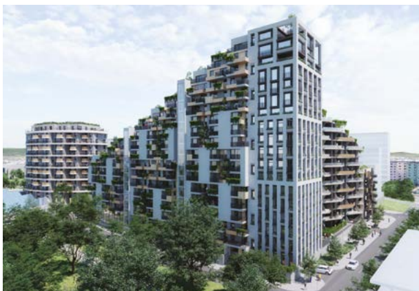
vizualizace: Západní Brána

V realizaci je projekt U Milosrdných na Praze 1 (kolaudace podzim 2024). Další z pražských projektů bytových domů jsou v přípravě: K Závěrce , Bytový dům Grébovka či Kačerov .